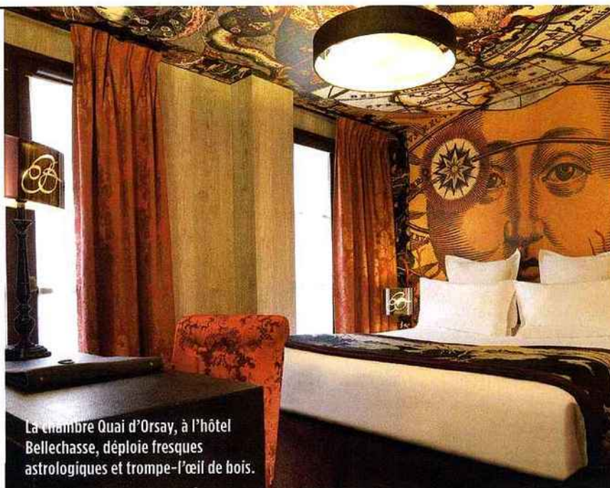
La chambre Quai d'Orsay, à l'hôtel Bellechasse, déploie fresques astrologiques et trompe-l'œil de bois.

les enseignes assez arrogantes pour imposer leur charte graphique jusqu'en face des Sept Merveilles du Monde. Cet impérialisme ne me parle pas. Nos hôtels n'ont pas la prétention de pratiquer des prix de palaces. Rien d'élitiste, au contraire. Ce sont des décors qui invitent à entrer et non des temples qui feraient tout pour intimider, dissuader ou filtrer les voyageurs. »